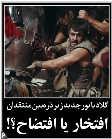
گلادیا تاور جدید زیر ذر بین منتقدان