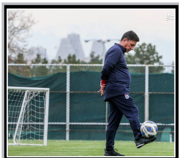
ادعای تحقق نیافته قلعه‌نویی درباره تغییر نسل تیم ملی