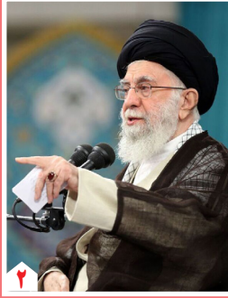
رهبر معظم انقلاب:

روح نصرالله و صفی الدین در میدان حاضر است