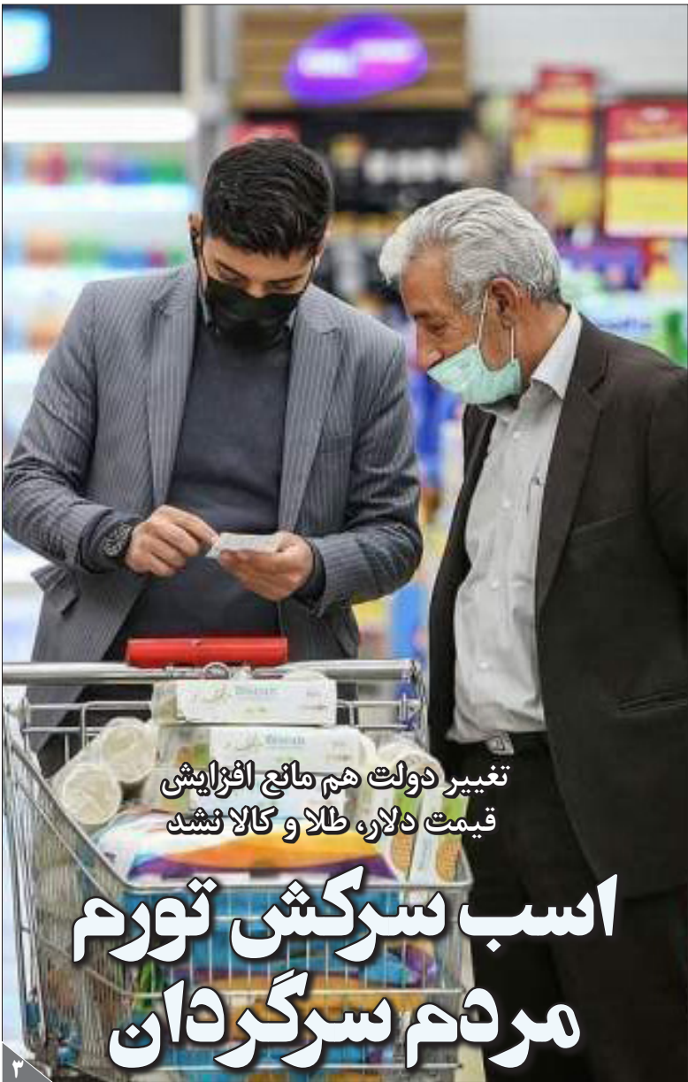
تغییر دولت هم مانع افزایش قیمت دلار، طلا و کالا نشد