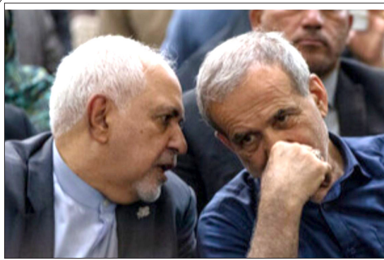
روایت محمدجواد ظریف از انتخابات تا انتصابات