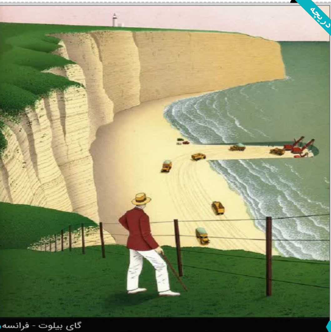
گوی بیلوت - فرانسه