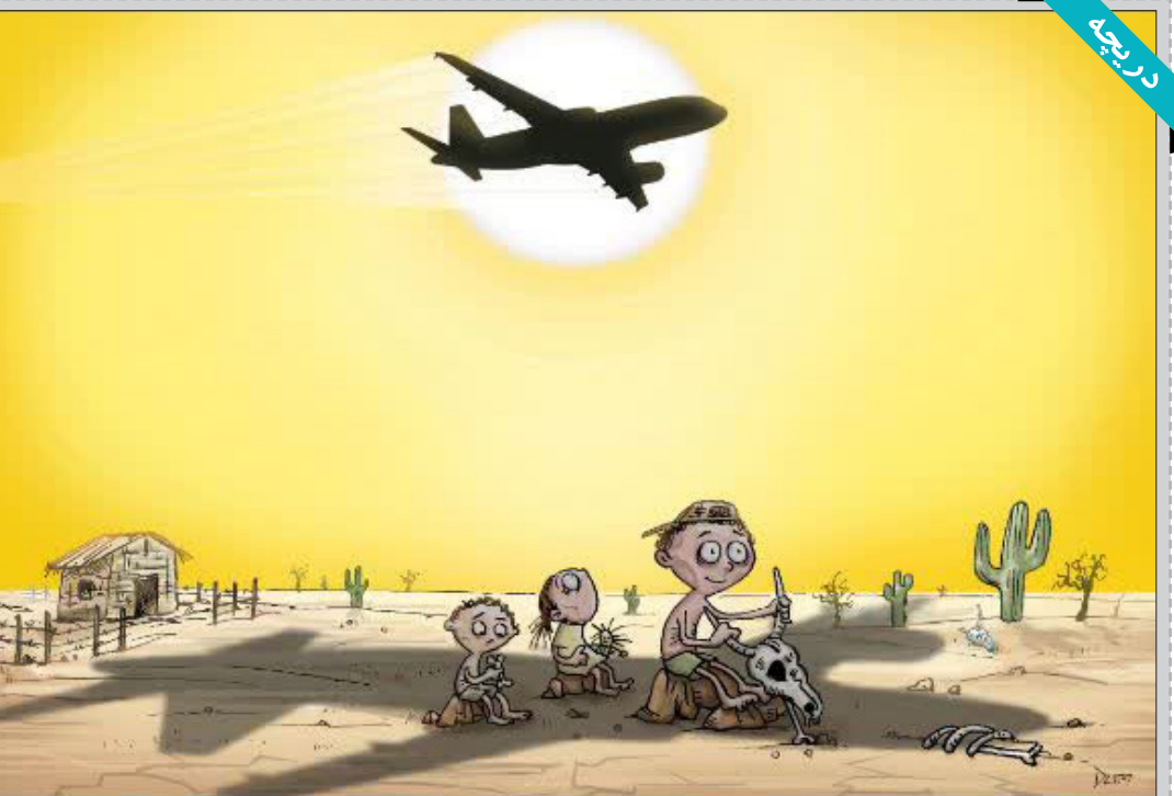
دام (ادسون جونویر) - برزیل