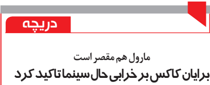
مارول هم مقصر است

برایان کاکس بر خرابی حال سینما تاکید کرد