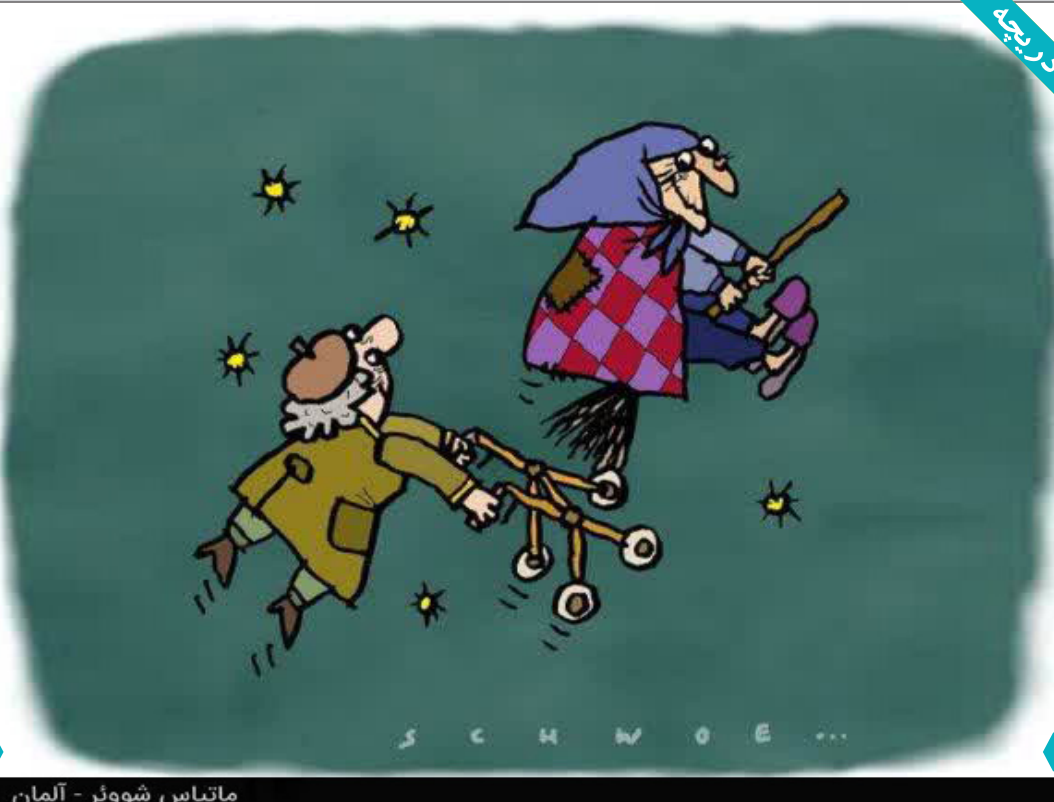
متیاس شووتر - آلمان