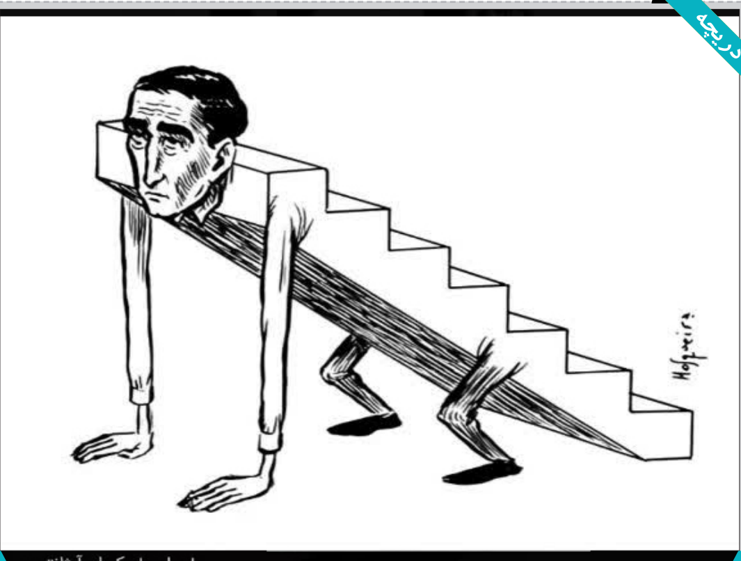
مارسلو ماسکیرا - آرژانتین