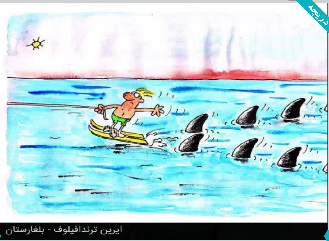
ایرین ترندافیوف - بلغارستان