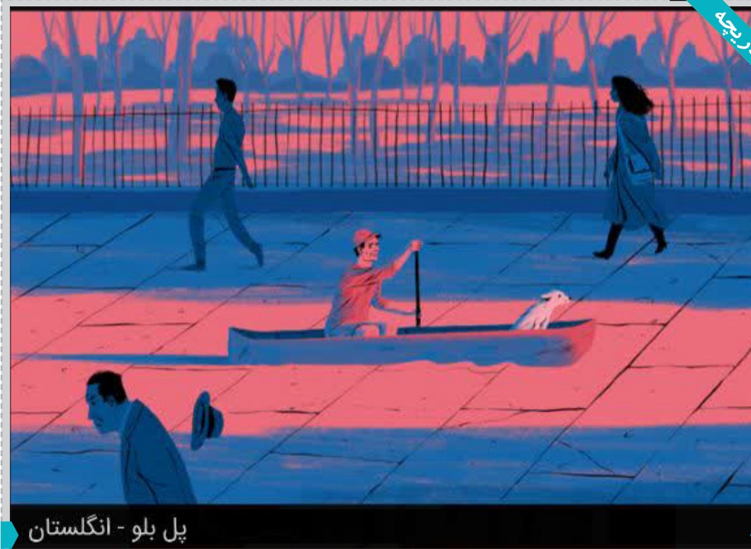
پل بلو - انگلستان

به‌اش نگفته بود، مثل زبـان درخت‌ها و باد را. اغلب با دانه‌هایی که فرومی‌افتادند سخن می‌پراندند و می‌گفت «میدوارم روی تکه زمینی نرم فرودآیی»، چون صدای دانه‌ها را می‌شنید که هنگام عبور از کنار گوشش چنین چیزی به یادش می‌افتد. جنی می‌دانست جهان به اندازه‌ی یک فصل شکوفه، یک فصل برگ و یک فصل پرتقال صبر کرد. اما، وقتی دوباره کرده‌ها شش‌شعبات خورشید را طلایی‌رنگ کردند و بر جهان آویختند، او از جا برخاست و به کنار در ورودی حیاط رفت و انتظار چیزها را کشید. چه چیزهایی؟ خودش هم دقیق نمی‌دانست. نفس‌هایش تند و پرحرارت بودند. جنی چیزهایی می‌دانست که هیچ‌کس قبلاً