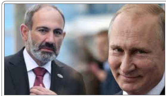
روابط با ناتو باعث بی‌ثباتی در قفقاز و پشیمانی می‌شود