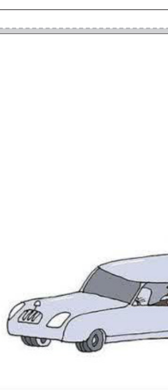
آلفردو مارتیرنا هرناندز - کوبا