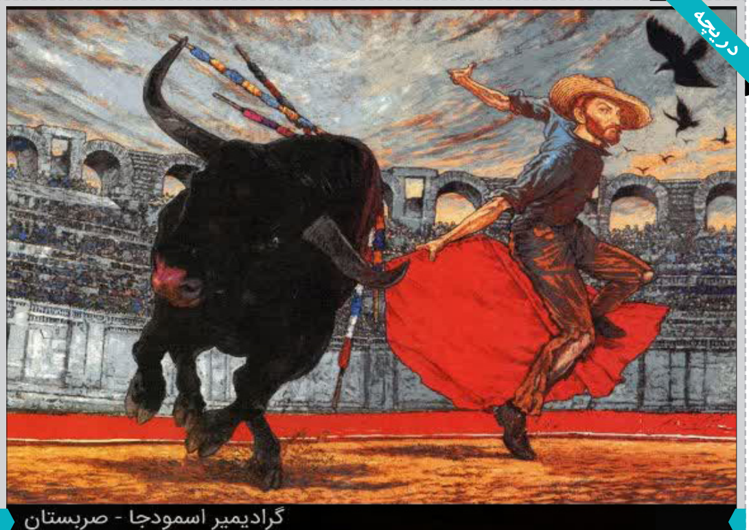
گرادیمیر اسودجا - صربستان