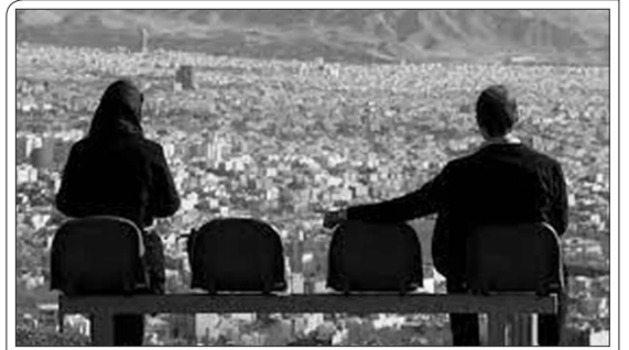
«همدلی» گزارش می‌دهد

همدلی | آرزو بخشنده: رقابت مجلسی‌ها در مرحله انتخابات به اتمام رسید. اما برخی معتقدند کسانی که با حمایت دولت به کرسی‌ها دست یافتند از رئیسی و دولت سیزدهم هم عبور خواهند کرد. این تحلیل گرچه از گذشته