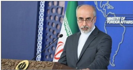
سخنگوی وزارت امور خارجه:

سه شنبه ۲۸ فروردین ۱۴۰۳ _ ۷ شوال ۱۴۴۵ _ ۱۶ آوریل ۲۰۲۴ سال نهم _ شماره ۲۳۹۸ _ صفحه ۸ _ قیمت ۱۰۰۰۰ تومان