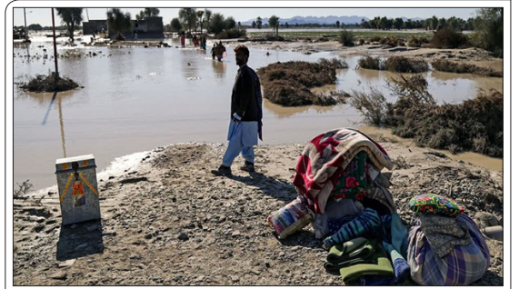
«همدلی» در پی ادامه بحران سیل در سیستان و بلوچستان گزارش می‌دهد: