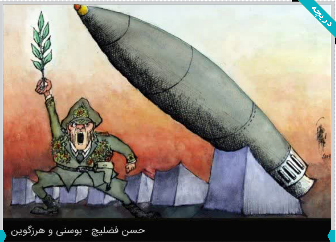
حسن فضلیچ - بوسنی و هرزگوین