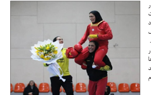
رئیس هیات ورزش‌های زورخانه‌ای و ورزشکاران سپاهان در روز قهرمانی

در هفته پایانی الهه منصوریان بانوی پرافتخار ووشو ایران به طور رسمی از دنیای قهرمانی این رشته رزمی خداحافظی کرد. او در طول دوران ورزشی خود افتخارات بسیار زیادی کسب کرد که از جمله آنها می‌توان به کسب ۴ مدال در بازی‌های بازی‌های آسیایی شامل ۳ نقره و یک برنز و همچنین ۵ مدال در مسابقات جهانی شامل ۳ طلا، یک نقره و یک برنز اشاره کرد. در پایان رقابت‌های لیگ برتر ووشو تیم فولاد مبارکه سپاهان با ۱۶ امتیاز به عنوان قهرمانی دست یافت و دانشگاه آزاد اسلامی با ۱۳ امتیاز به عنوان نایب قهرمانی شد.