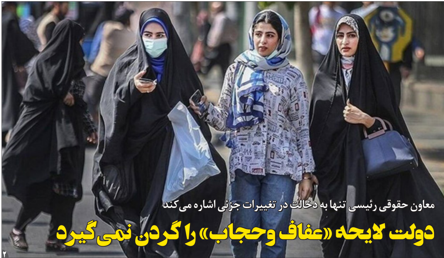
معاون حقوقی رئیس تنها به دخالت در تغییرات جزئی اشاره می‌کند

همدلی | وزارت اطلاعات با صدور بیانیه‌ای اعلام کرد: از دو تروریست معدوم انتحاری، یک نفر ملیت تاجیکستانی داشته و هویت تروریست دوم هنوز به صورت قطعی احراز نشده