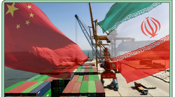
شرکت ملی نفت در مورد توقف صادرات نفت به چین پاسخ روشن نمی‌دهد

است. با شناسایی عوامل انتقال تروریست‌ها به داخل کشور، اولین عملیات دستگیری عوامل مذکور در غروب روز حادثه انجام شد. در بامداد روز بعد (پنج‌شنبه ۱۴ دی ماه) اقامتگاه