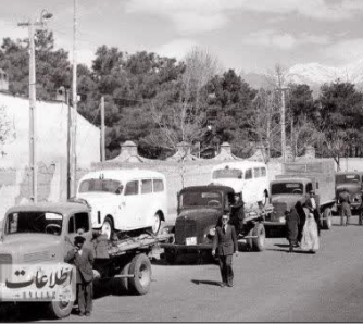
کند ولی رضا شاه با مصادره املاک و مستغلاتش خیلی روی خوش به حسین‌خان نشان نداد. خانه باغ میرزا حسین خان را از او گرفت و قصد داشت کاخی برای خود بسازد که قدرت و سلطنت خود را به رخ جهانیان بکشد و فرزندانش را در آنجا اسکان دهد.