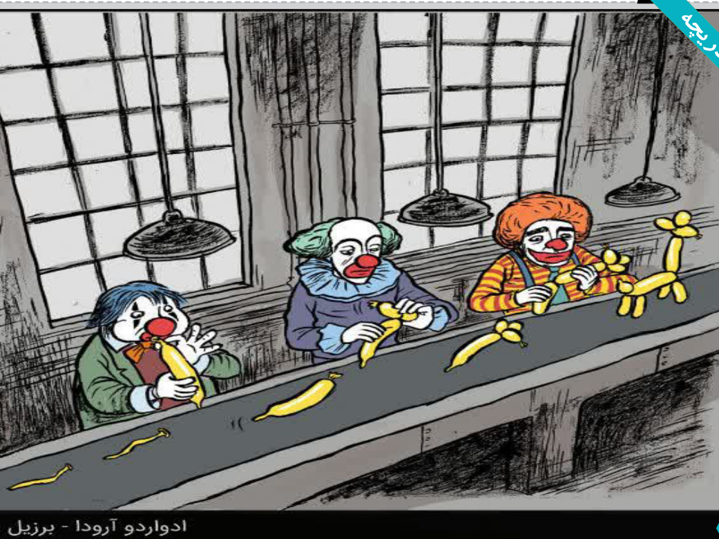
ادواردو آرودا - برزیل