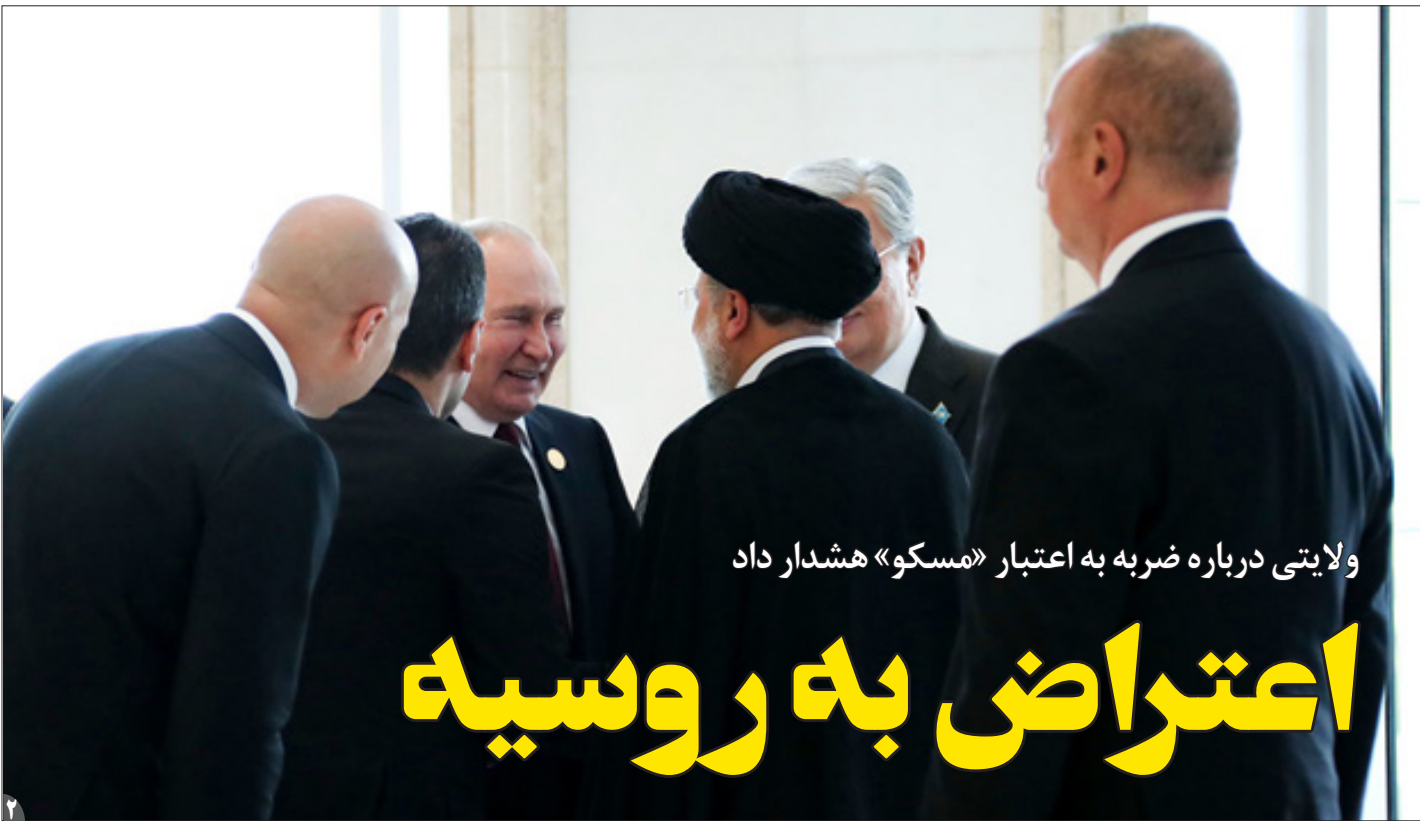
ولایتی درباره ضربه به اعتبار «مسکو» هشدار داد