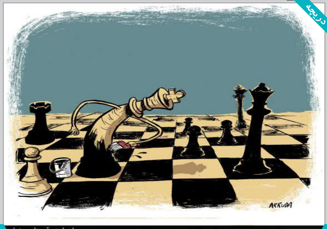
ادواردو آرودا - برزیل

کمیسیون معاملات شرکت معدنی و صنعتی گل گهر