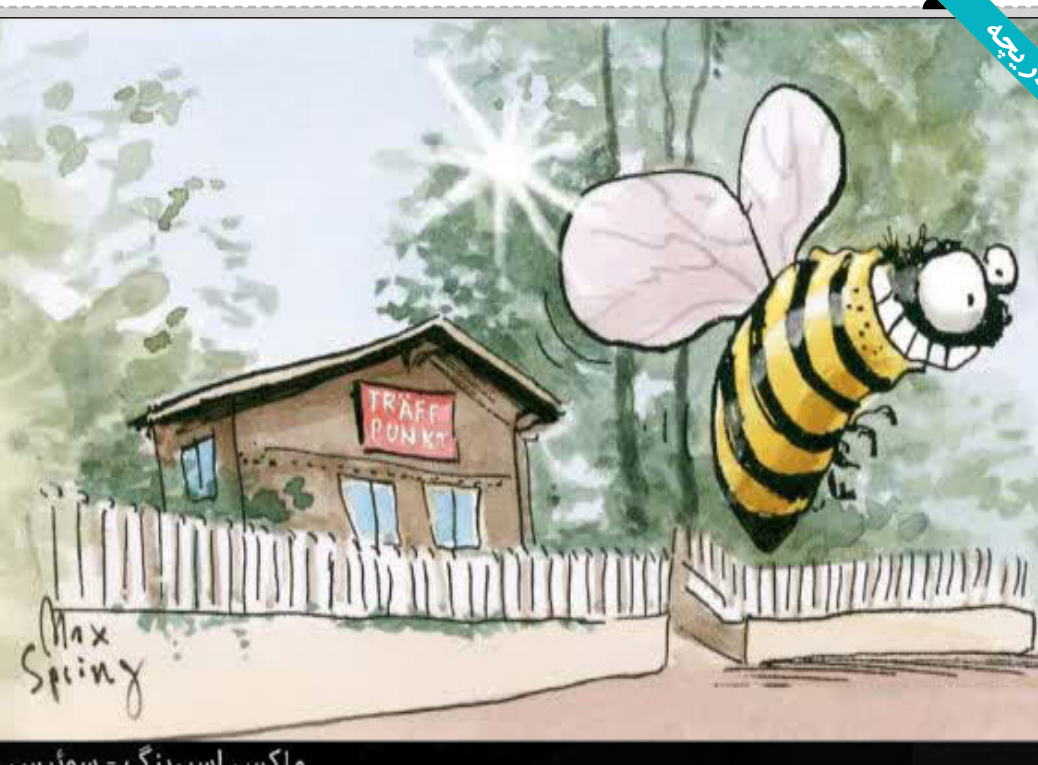
ماکس اسپرینگ - سوئیس