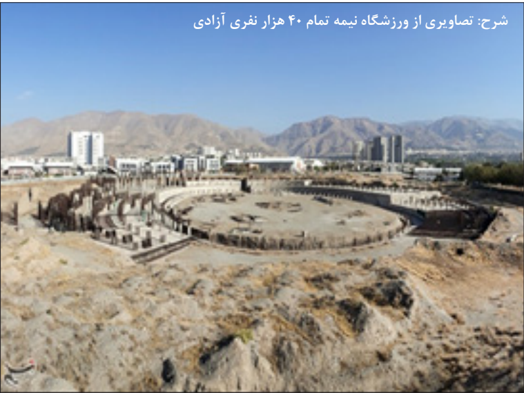
شرح: تصاویری از ورزشگاه نیمه تمام ۴۰ هزار نفری آزادی

به گفته مسئولان سازه‌های آن باید تخریب شود چرا که از بتن غیر استاندارد(با آب شور دریا) ساخته شده است. از دهکده‌های المپیک تا ورزشگاه‌های ۴۰ هزار و ۶۰ هزار نفره