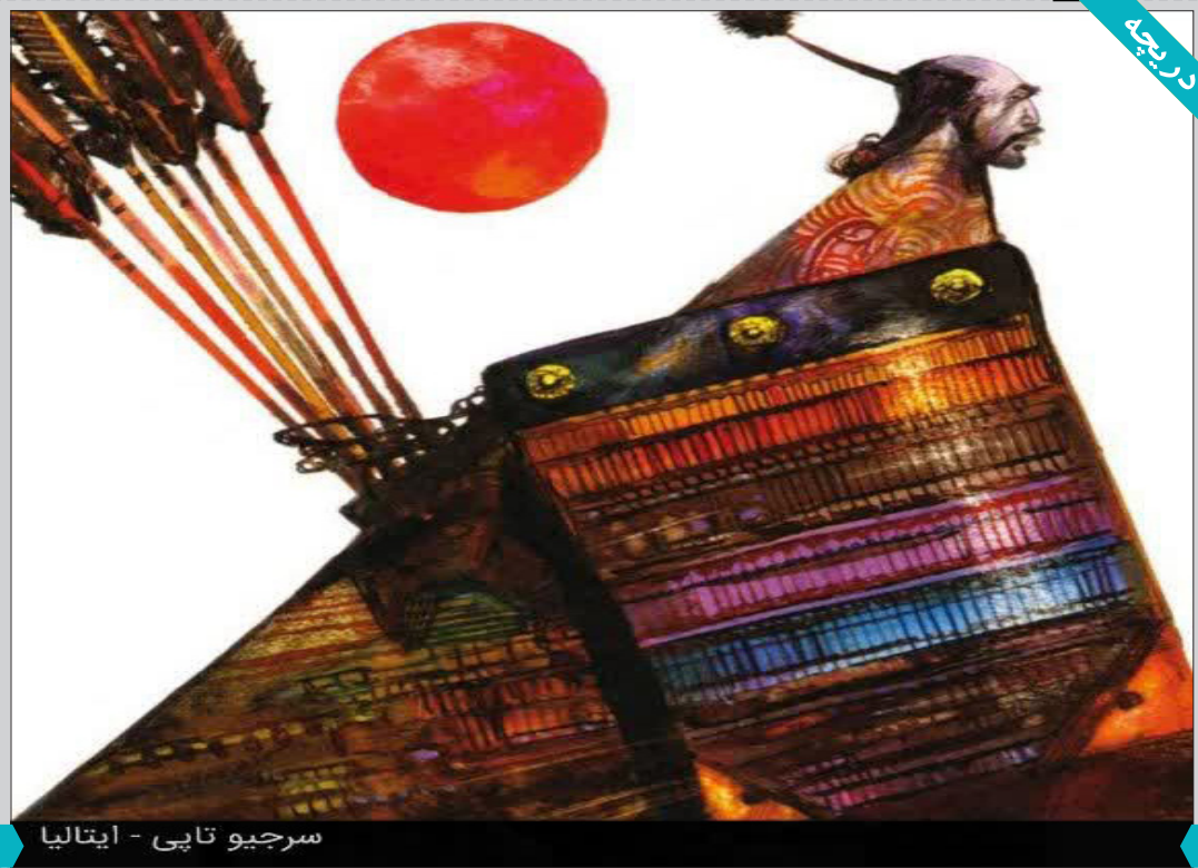
سرجیو تاپی - ایتالیا