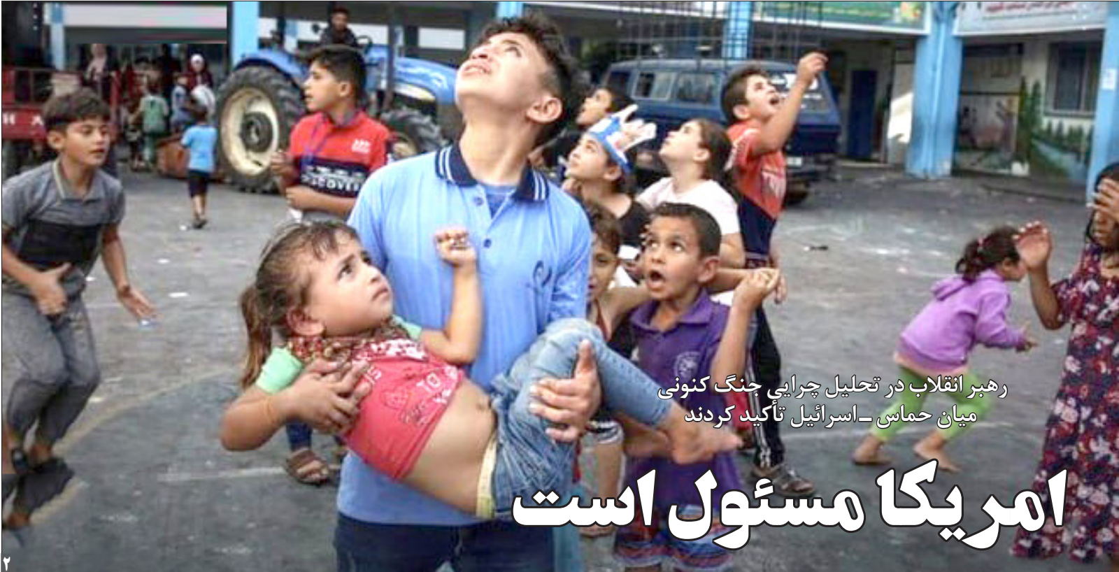
رهبر انقلاب در تحلیل چرایی جنگ کنونی میان حماس - اسرائیل تأکید کردند

همدلی | امید کوشا: حضور «جو بایدن» در منطقه در حالی انجام می‌شود که تهدیدهای دو طرف درگیر در جنگ غزه رو به فزونی گذاشته و بازیگران منطقه‌ای و بین‌المللی در انتظار واکنش‌ها به این سفر هستند. برخی از تحلیلگران بر این عقیده‌اند که تنش‌ها میان فلسطینیان و اسرائیل به گسترش دامنه برخوردها و جنگی بزرگتر ختم خواهد شد و برخی نیز