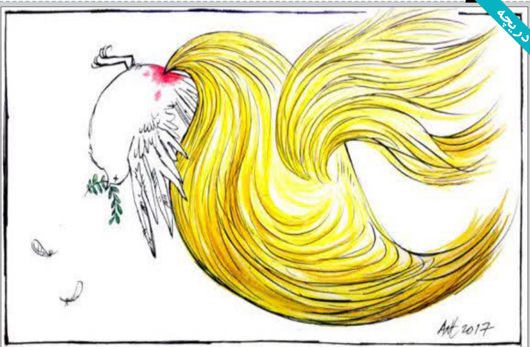
آنتونی گارنر - انگلستان

احمد اعطا که به احمد محمود معروف بود زاده ۱۳۱۰ اهواز - درگذشته ۱۲ مهر ۱۳۸۱ است. او ا پیرو مکتب رئالیسم اجتماعی می‌دانند. معروف‌ترین رمان او همسایه‌ها در زمرة آثار برجسته ادبیات معاصر ایران شمرده می‌شود. او بدرومادری درفولی زاده شد و شاید به همین دلیل بیشتر خود را درفولی می‌دانست. در برخی از آثارش چون همسایه‌ها و مدار صفر درجه، وازه‌ها و جمالتی به گویش درفولی به چشم می‌خورد و نیز شخصیت «عمت» در داستان «فربیه‌ها و پسرک بومی» از کتابی به همین نام نیز از یکی از اهالی درفول به نام نعمت علایی گرفته شده‌است که حدود سال ۱۳۳۲ در ذوقول به‌دست افراد ناشناسی ترو شده است. او در سال ۱۳۲۹ دوره متوسطه را شبانه در دبیرستان شاپور اهواز به پایان رساند و پس از سپری کردن دوران تحصیلات ابتدایی و متوسطه در زادگاهش، به دانشکده افسری ارتش راه یافت؛ اما از جمله تعداد زیاد دانشجویان دانشکده افسری بود که پس از ۲۸مرداد ۱۳۳۲ بازداشت و سپس بخش‌بخش آزاد شدند؛ درحالی‌که تنها ۱۳ نفر از آنان در زندان باقی ماندند. یکی از این دانشجویان بود که توبه‌نامه امضا نکرد، به همین دلیل مدت زیادی را در زندان به‌سر برد. او مدتی هم در حوالی خلیج‌فارس، از جمله در بندر لنگه، در تبعید به سر برد و البته خودش از این دوران باعنوان: «... زمانی که گرفتار