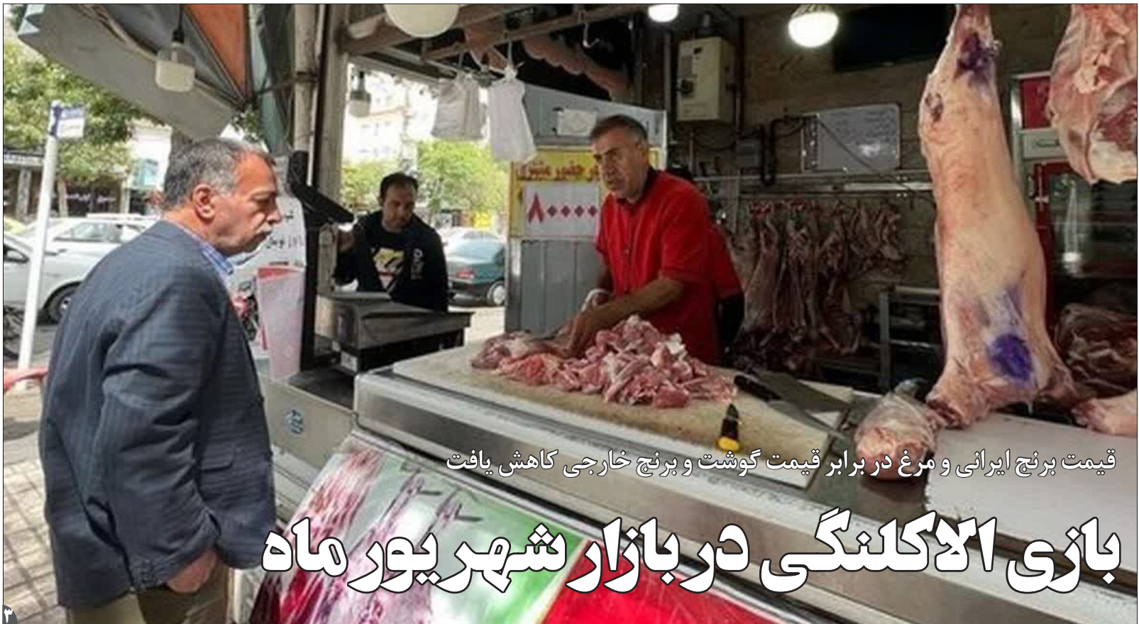
قیمت پرئج ایرانی و مرغ در برابر قیمت گوشت و پرئج خارجی کاهش یافت

و مرکز آموزشی یا ارتقای سرنانه آموزشی چند صدمی هم دردی از استان‌هایی که از سرنانه مطلوب آموزشی محروم هستند دوا نمی‌کند.