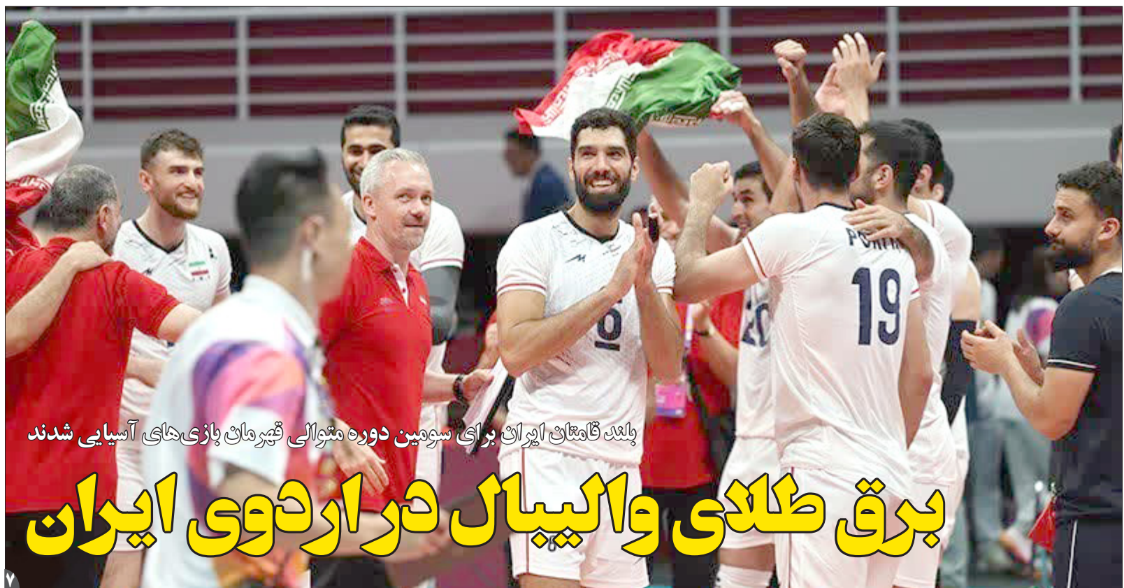
بلندگامان ایران برای سوئیمین دوره متوالی قهرمان بازی‌های آسیایی شدند

همدلی | حسین امیرعبداللهیان، وزیر امور خارجه جمهوری اسلامی، از «ابتکار عمل» ژاپن برای شروع دوباره مذاکرات هسته‌ای پس از چندین ماه توقف، خبر داد و گفت که تهران هرگونه پیشنهاد تویکیو را هم‌راستا با منافع ایران باشد، مثبت