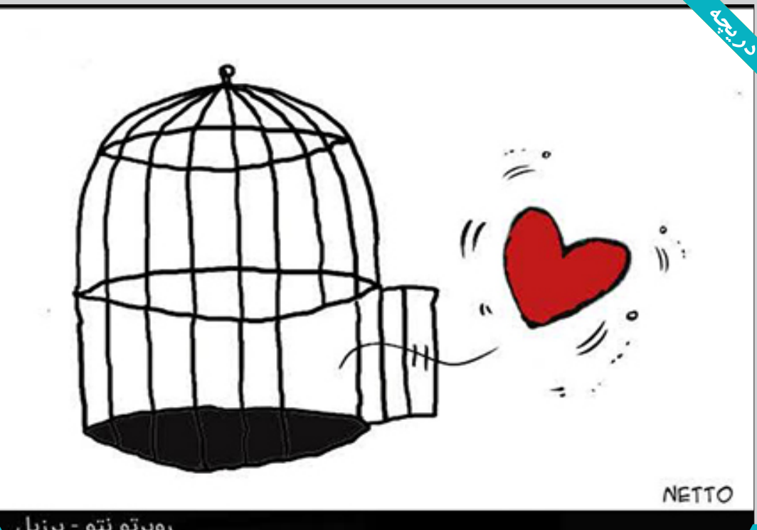
روبرتو نتو - برزیل