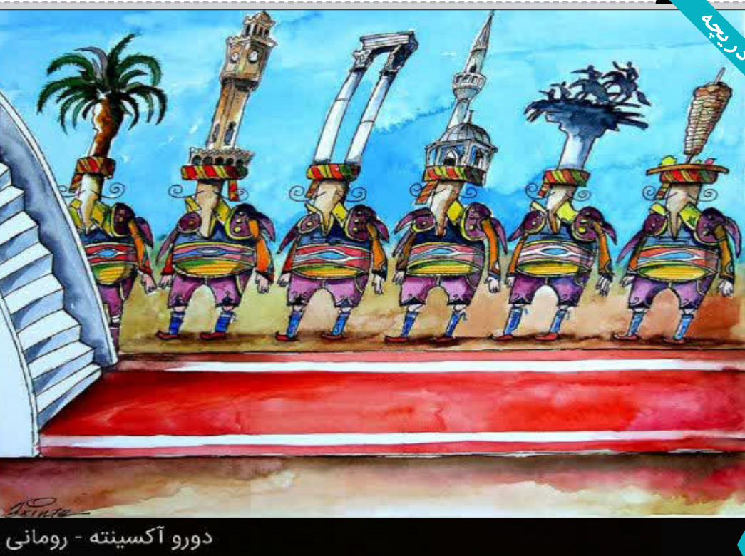
دورو آکسینته - رومانی