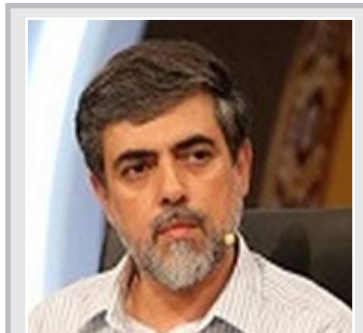
دبیر ستاد امر به معروف برکنار شد