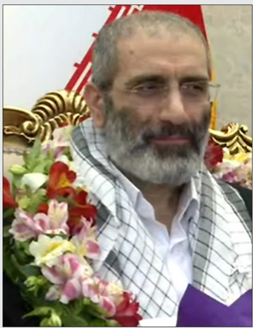
آزادی دیپلمات ایران در اتریش وزندانی این کشور در ایران؛