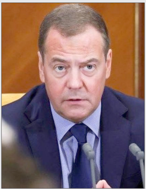
از ادامه چنده ساله جنگ تا تقسیم بین روسیه و اروپا