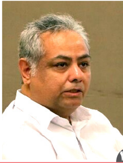
در گفت‌وگو ی همدلی با مدیر کمیسیون دفاع از حقوق معلولان مطرح شد:

روزنامه سیاسی، اقتصادی، اجتماعی و فرهنگی صبح ایران