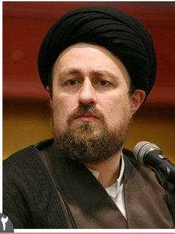
حجت الاسلام والمسلمین سید حسن خمینی: