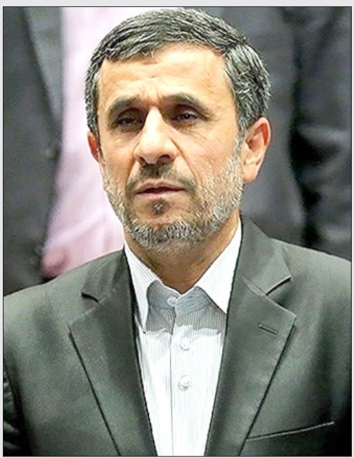
بی‌گیری جایگاهی اشیا از ساختمان دولت بی‌نتیجه ماند