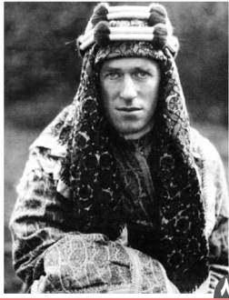
لورنس عربستان چگونه اعراب را به دام استعمار افکند

روزنامه سیاسی، اقتصادی، اجتماعی و فرهنگی صبح ایران