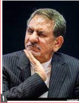
پاسخ جهانگیری به برخی سئوالات: