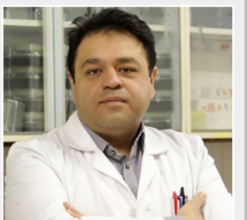
گفتگوی همدلی با یک ویروس‌شناس درباره بازگشت کرونا

دهد. حتی برخی به پیشواز رفتند و خبر استعفای او را در صحن اعلام کردند. این فشار نمایندگان برای برکناری رئیس سازمان برنامه و بودجه در حالی است که نمایندگان متعهد هستند تغییر تیم اقتصادی دولت یک ضرورت است. ضرورتی که رئیس خیلی به آن توجهی نمی‌کند ولی با این حال فشار نمایندگان بر آنان زیاد است.