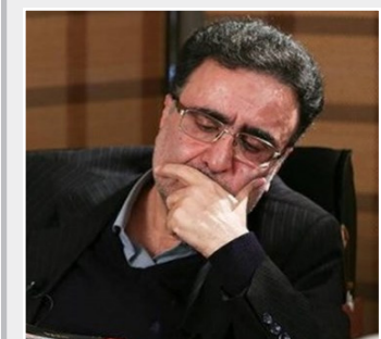
تغییرات سیاست خارجی در کانون توجه چهره اصلاح طلب