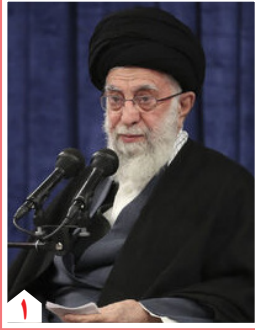
رهبر انقلاب در دیدار با مسئولان نظام :