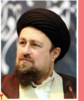
سید حسن خمینی در دیدار با نمایندگان مجلس: