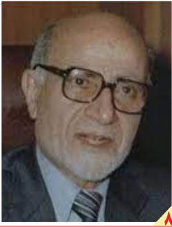
۱۷ بهمن ۱۳۵۷: حمایت مردم از نخست‌وزیری بازرگان

روزنامه سیاسی، اقتصادی، اجتماعی و فرهنگی صبح ایران