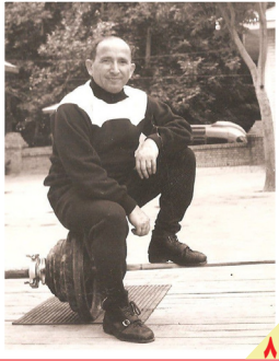
سالروز درگذشت جعفر سلماسی؛

روزنامه سیاسی، اقتصادی، اجتماعی و فرهنگی صبح ایران