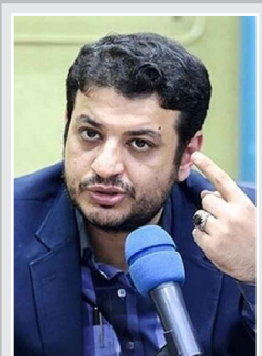
نگاهی به جنجال‌های اخیر «علی‌اکبر رافتی‌پور»

همدلی | موج جدیدی از ادعاهای غرب بر علیه ایران، با هدف بالا بردن تنش بین ایران و کشورهای غربی در حالی دنبال می‌شود که به تازگی کشورهای اروپایی خط مشی بسیار سختگیرانه‌ای را در برابر ایران پایه‌گذاری کرده‌اند. این در شرایطی است که از یک سو مقام‌های واشنگتن به صراحت از افزایش همگرایی با رژیم صهیونیستی در تقابل با ایران یاد می‌کنند و