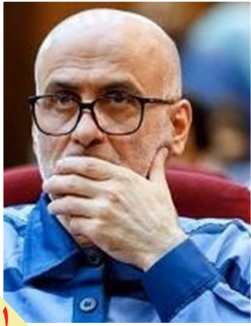
یک وکیل دادگستری مطرح کرد؛