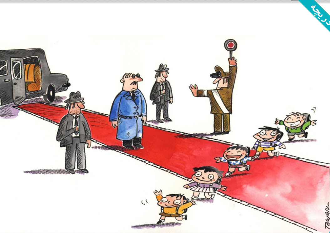
تاوان چونترا - تایلد