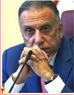
از سوی برخی گروه‌های عراقی اتهام الکاذمی تقویت شد