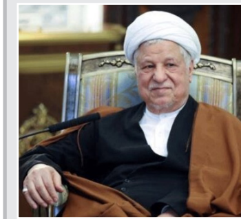
گزارش دقیقی از علت مرگ آیت‌الله هاشمی منتشر نشده است