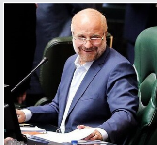
آیا رئیس مجلس رقابت انتخاباتی را شروع کرده است؟