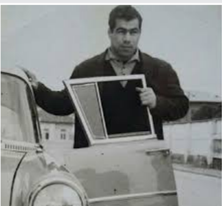
آخرین روز جهان پهلوان تختی در هتل آتلانتیک