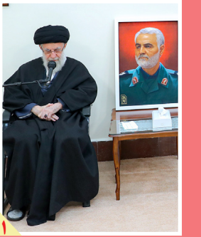
رهبان انقلاب در دیدار اعضای ستاد بزرگداشت شهید سلیمانی؛