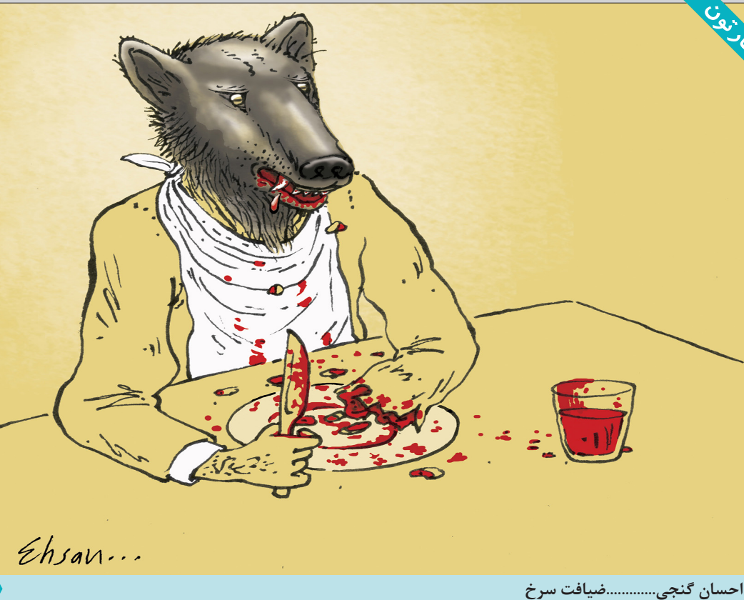
احسان گنجی.....ضیافت سرخ