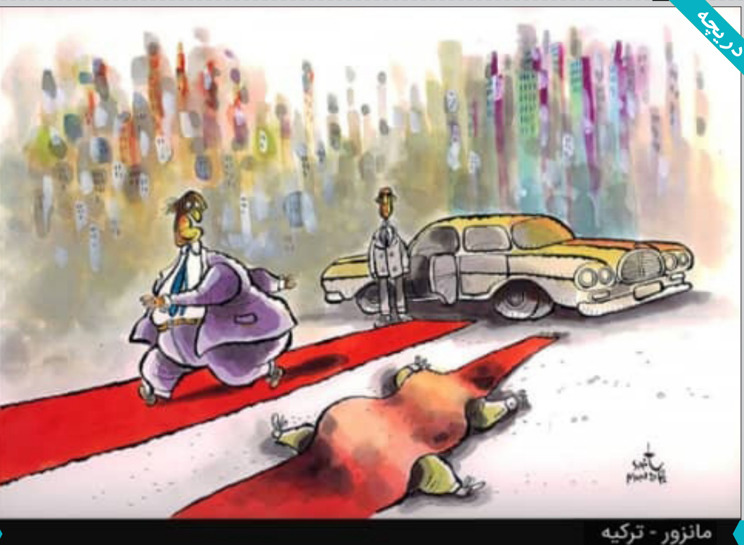
مانزور - ترکیه