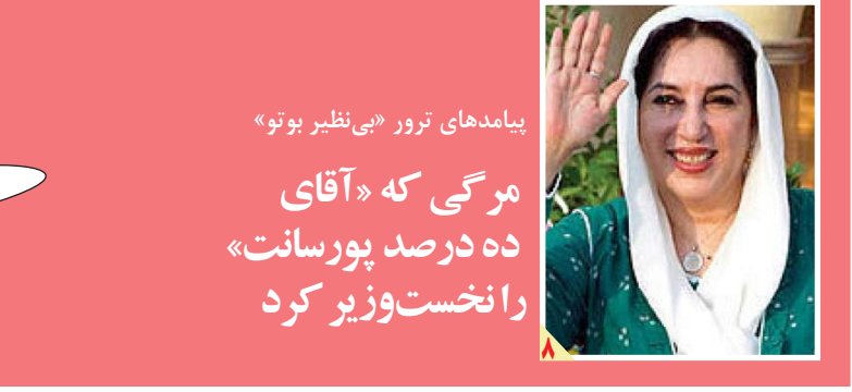
پيامدهای ترور «بی نظیر بوتو»

مرگی که «آقای ده درصد پورسانت» را نخست‌وزیر کرد