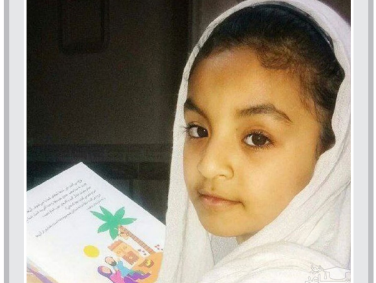
دختر نوجوان هر مزگانی چگونه هدف تیراندازی قرار گرفت؟