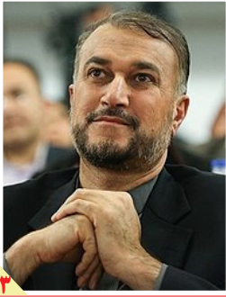
سخنان امیر عبدالهیان درباره اعتراضات در ایران