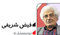
فیض شریفی نویسنده

پیش از بازی‌های جام جهانی قطر، گفتیم که کی‌روش با اتوبوس دفاعی به جایی نمی‌رسد و باید به‌طور واقعی ۴، ۳، ۲، ۱ بازی کند. کی‌روش ظاهرأ در بازی دوم و سوم ۴، ۳، ۲، ۱ بازی کرد اما در واقع این دو بازی اتوبوسی ۵، ۴، ۱ بود و وقتی متوجه شد که باید نتیجه بگیرد فحله کرد و بر اثر اتفاق، با اخراج دروازبان ولز، توانست در دو حرکت این تیم ضعیف را شکست دهد. ایران نه خوب بازی کرد و نه خوب نتیجه گرفت و تاج با تعویض مربی پیشین، هم اسکوچیچ را سوزاند و هم کی‌روش را منفورتر کرد. حالا باید دید تیم ایران در واقع باید خیلی هزینه کند تا یک مربی بزرگ را در تراز بین‌المللی به استخدام درآورد. مربی بزرگ هم باید نیمی از این بازیکنان را حذف کند و تیم ایران را مثل تیم آمریکا جوان کند و بازیکن‌سالاری را کنار بگذارد. جام جهانی قطر نشان داد که عناوین جهانی افتخار نمی‌آورد و تیمی را برنده نمی‌کند؛ باید سیستم مدیریتی و مربی‌گری موجود را عوض کرد، دیگر حفظ توپ در زمین تاج و کی‌روش جواب نمی‌دهد، قبلاً هم این شیوه جواب