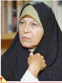
با اعلام سه اتهام از سوی وکیل تشریح شد: