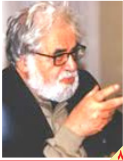
سالروز درگذشت احسان نراقی:

روزنامه سیاسی، اقتصادی، اجتماعی و فرهنگی صبح ایران