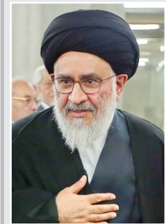
آیت‌الله محقق داماد؛ ترجیح می‌دهم سکوت کنم