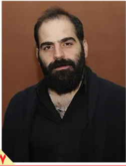
گفت‌وگوی همدلی با مهیار علیزاده: آهنگساز