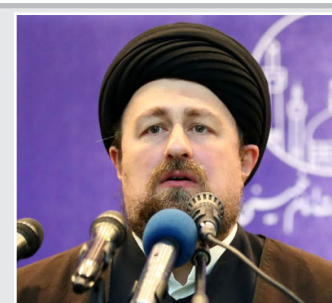
توصیه سید حسن خمینی درباره شرایط کنونی: