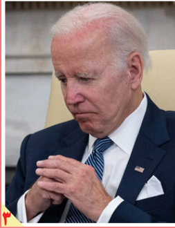
ایالات متحده آمریکا، امروز صحنه انتخابات کنگره است