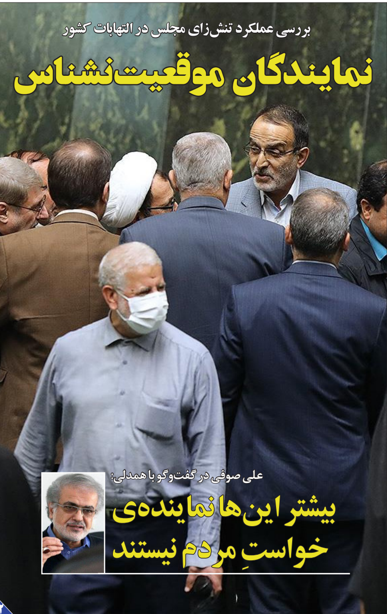
بررسی عملکرد تش‌زای مجلس در التیامات کشور