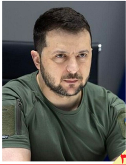
افزایش تحرک رئیس‌جمهور اوکراین درباره پیمانها

روزنامه سیاسی، اقتصادی، اجتماعی و فرهنگی صبح ایران